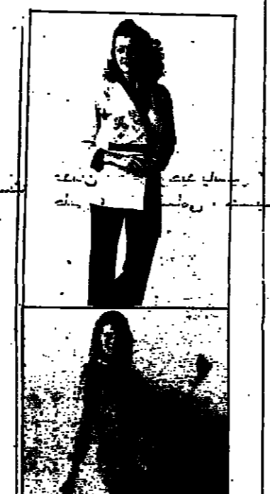
من عند رازوريل، زي نوم ابيض مرقع عند الصدر والخصر زائر رفيع يقف من الجيب، رمادية وعلى الجيب الحرف الجول من اسك.